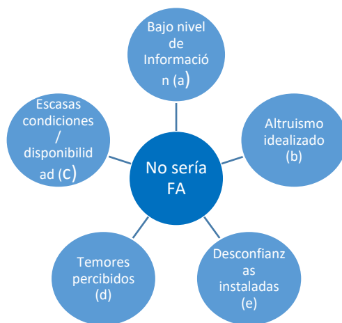
Figura 2. Factores obstaculizadores para convertirse en Familia de Acogida

El análisis de la información recogida a través de los grupos focales permitió responder la pregunta sobre barreras y facilitadores, las que se expresan en distintas dimensiones. Las barreras se sintetizan en la figura a continuación (ver figura 2).